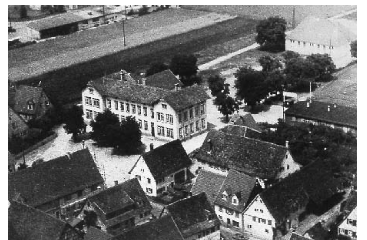
Langgass-Schule und Turnhalle nach 1945

Am 15. August 1881 wurde die Schule in der Langgass eingeweiht. Das Gebäude hatte man auf dem Viehmarkt, dem Gelände der schon früher abgebrochenen großen Mössinger Zehntscheuer, errichtet. Träger der Volksschule war die Kirchengemeinde. Mit dem Umzug der seit 1844 getrennten Mädchen- und Knabenschule in ein gemeinsames Schulhaus wurde auch der Schulbetrieb neu organisiert. Es gab nun je eine Knaben- und Mädchenelementarklasse (erste und zweite Klasse), eine gemischte Mittelklasse (dritte und vierte Klasse) und eine obere Knaben- und eine obere Mädchenklasse (die fünfte, sechste und siebte Klasse). In der Regel bestand eine Klasse aus 70 bis 90 Schülern.